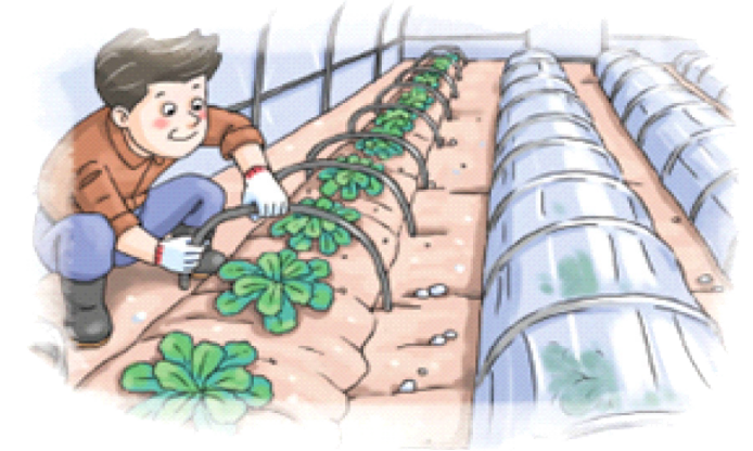
◦ 시설파손, 저온피해 우려시 소형터널 설치