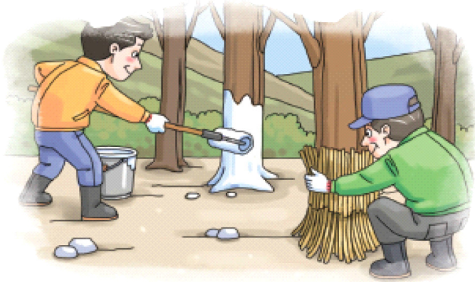
◦ 과수 주간부 벗짚피복 또는 수성페인트 칠하기