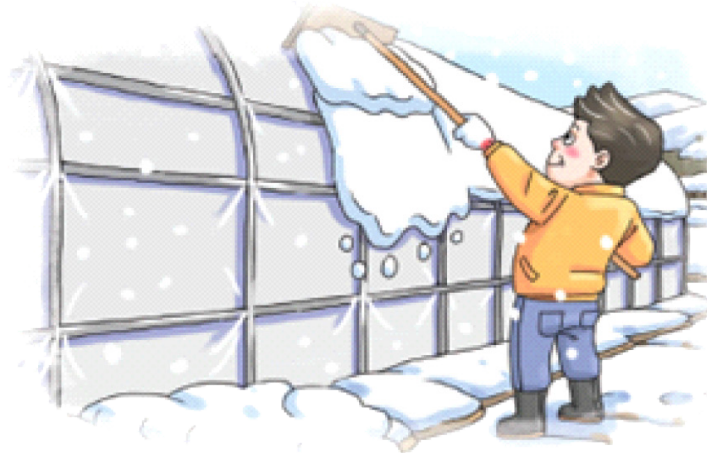
◦ 하우스 위 눈 쓸어내기