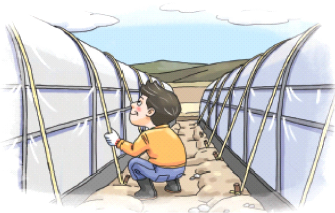
◦ 시설하우스 고정끈 설치 및 보강