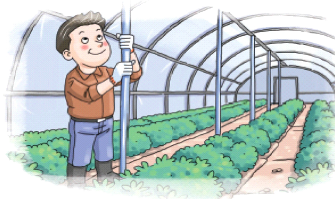
◦ 노후화된 시설 등은 보강지주 설치